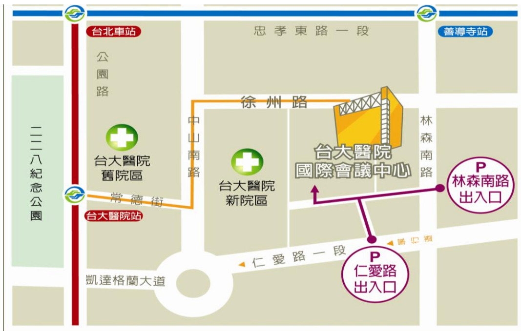
會議中心位置及停車動線圖

->搭乘板南線(藍線)至善導寺站 2 號出口，沿林森南路往南走經青島東路、濟南路，遇徐州路右轉，步行約 7-10 分鐘內即可抵達。